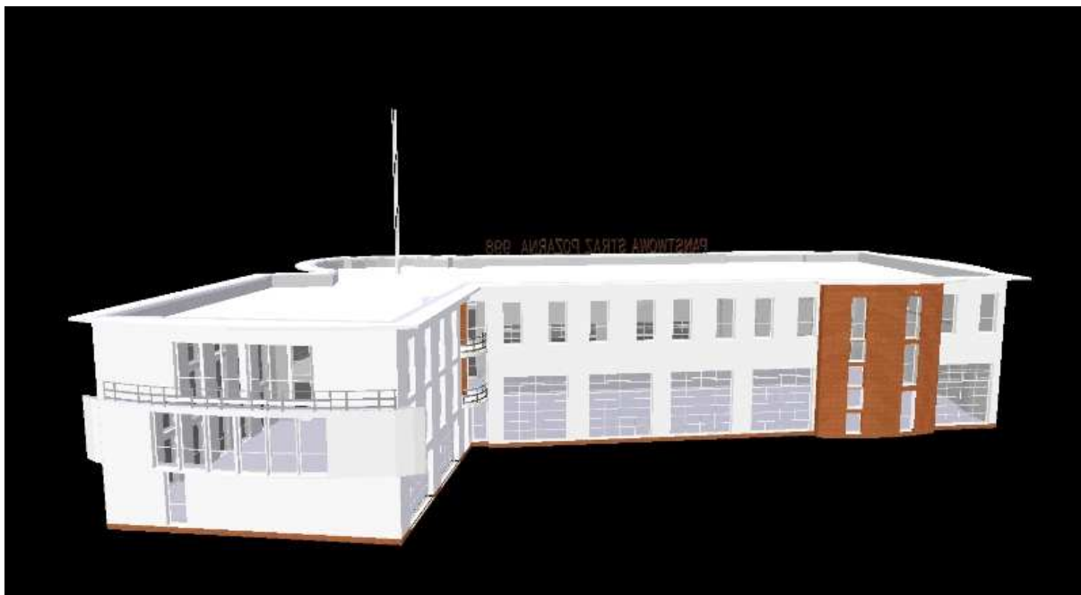
Fot.12 Widok wschodni budynku strażnicy od strony firmy Morris (wizualizacja) – PSP Kazimierza Wielka.