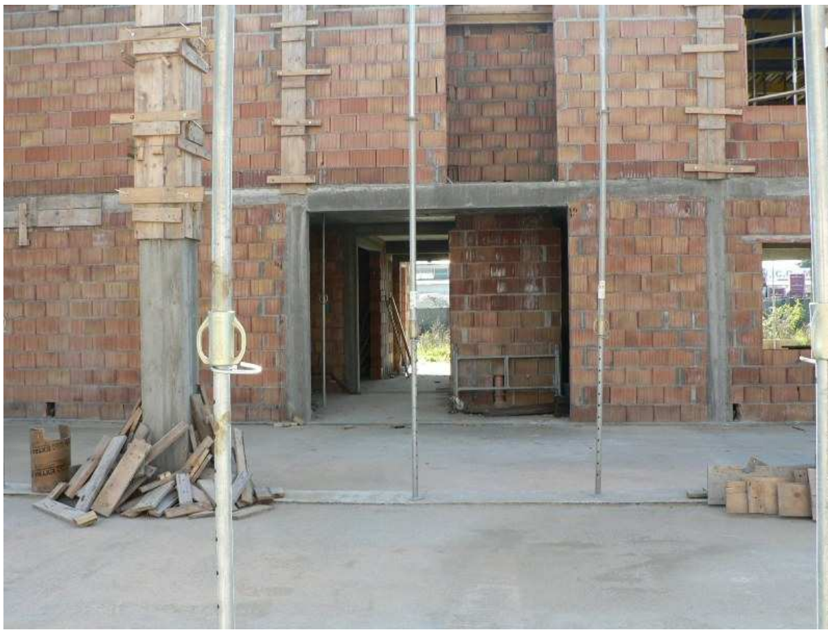
Fot. 8 Widok pomieszczeń garażowych – PSP Kazimierza Wielka.