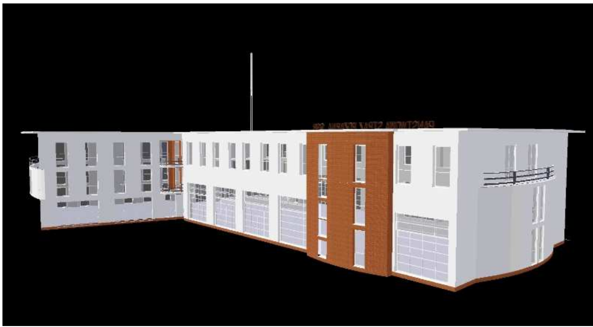
Fot.11 Widok tył budynku strażnicy część pn. – wsch. (wizualizacja) – PSP Kazimierza Wielka.