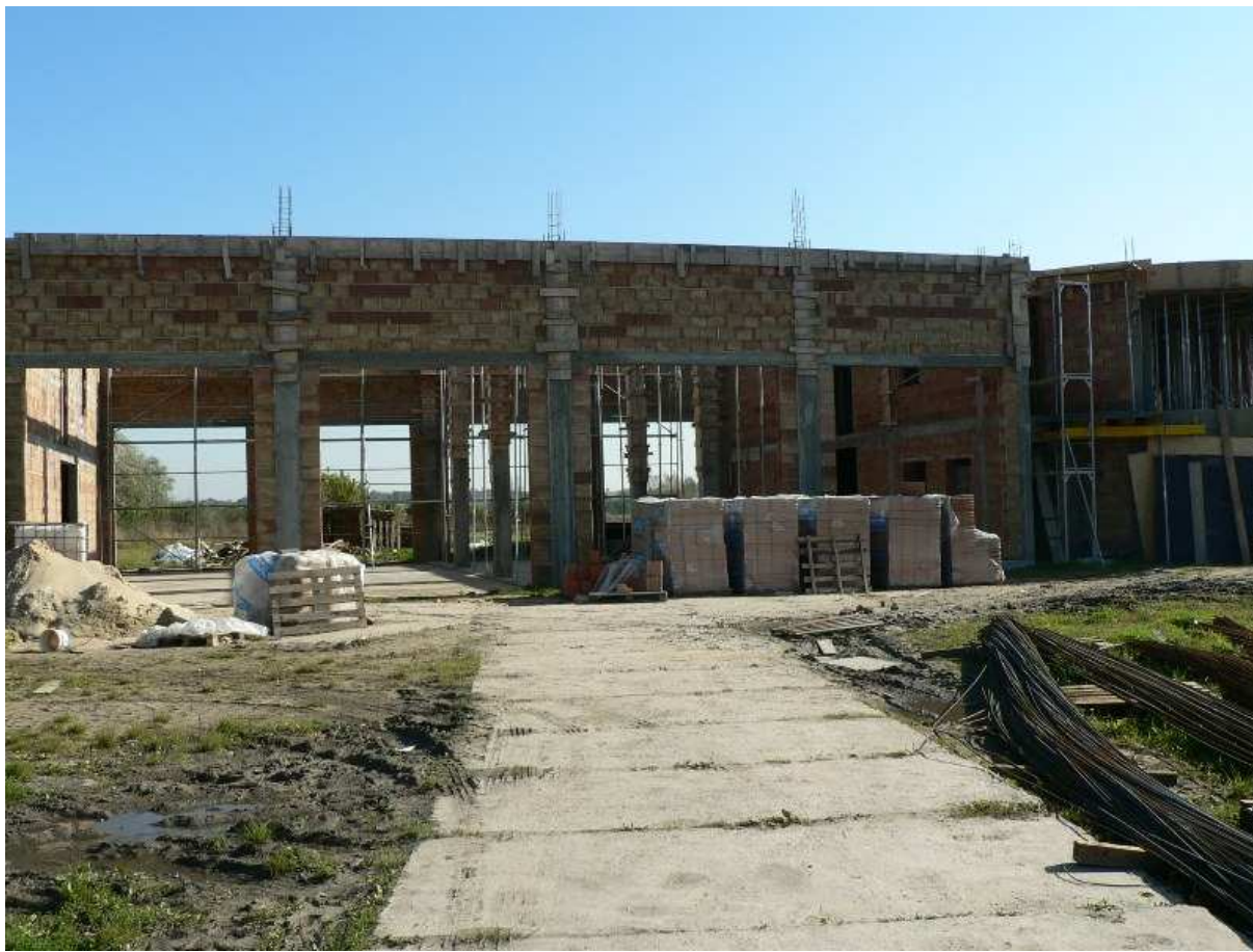
Fot.3 Wejście od strony głównej, ulicy Kolejowej – PSP Kazimierza Wielka.