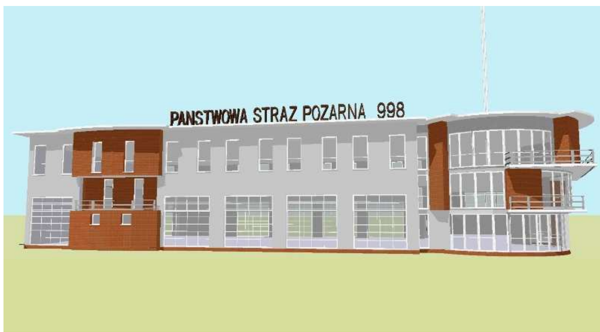
Fot.9 Widok budynku od strony drogi ulicy Kolejowej. (wizualizacja) – PSP Kazimierza Wielka.