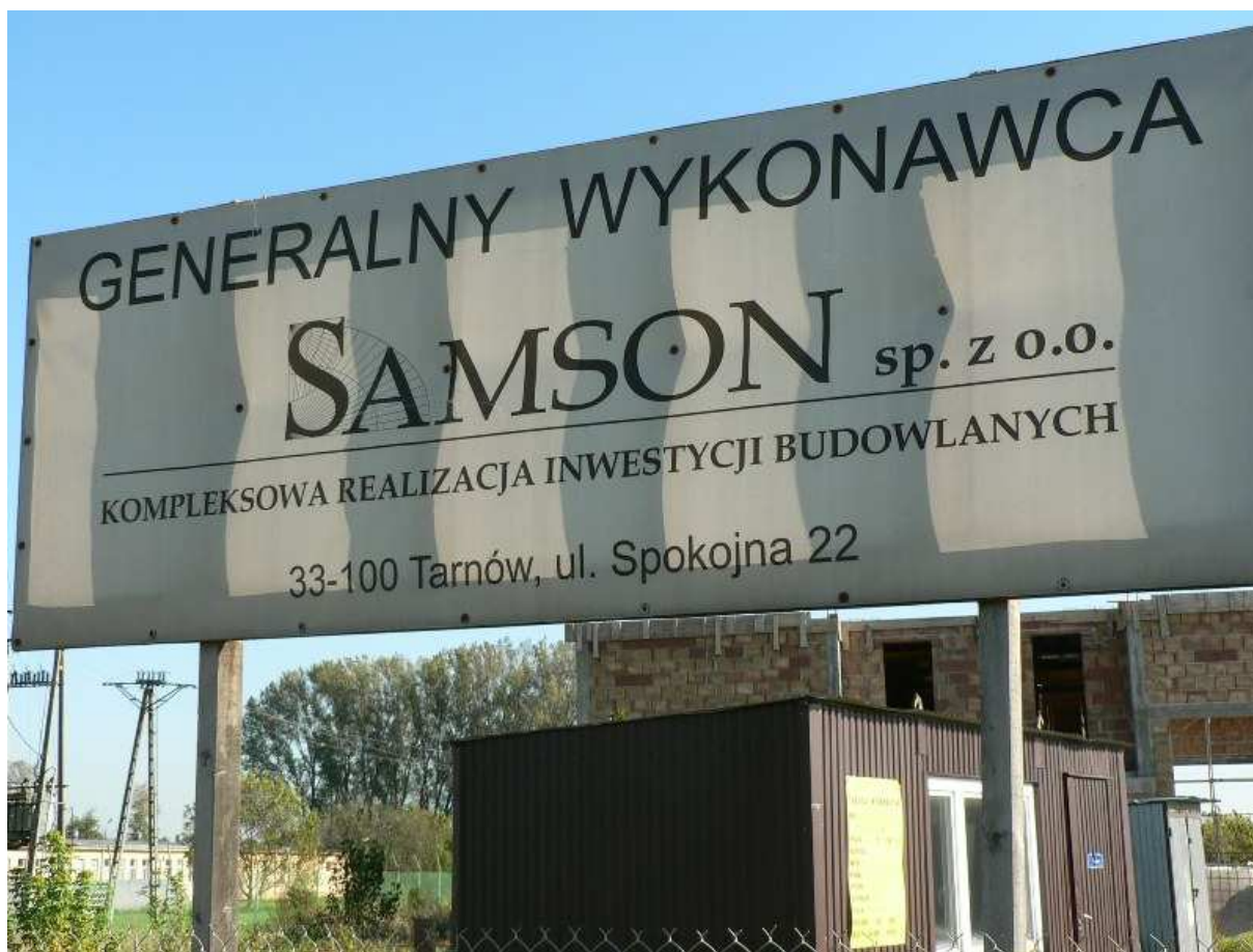
Fot.2 Kompleksowa realizacja inwestycji – wykonawca – „Samson sp. z o.o.” - „Budowa Strażnicy PSP w Kazimierzy Wielkiej”