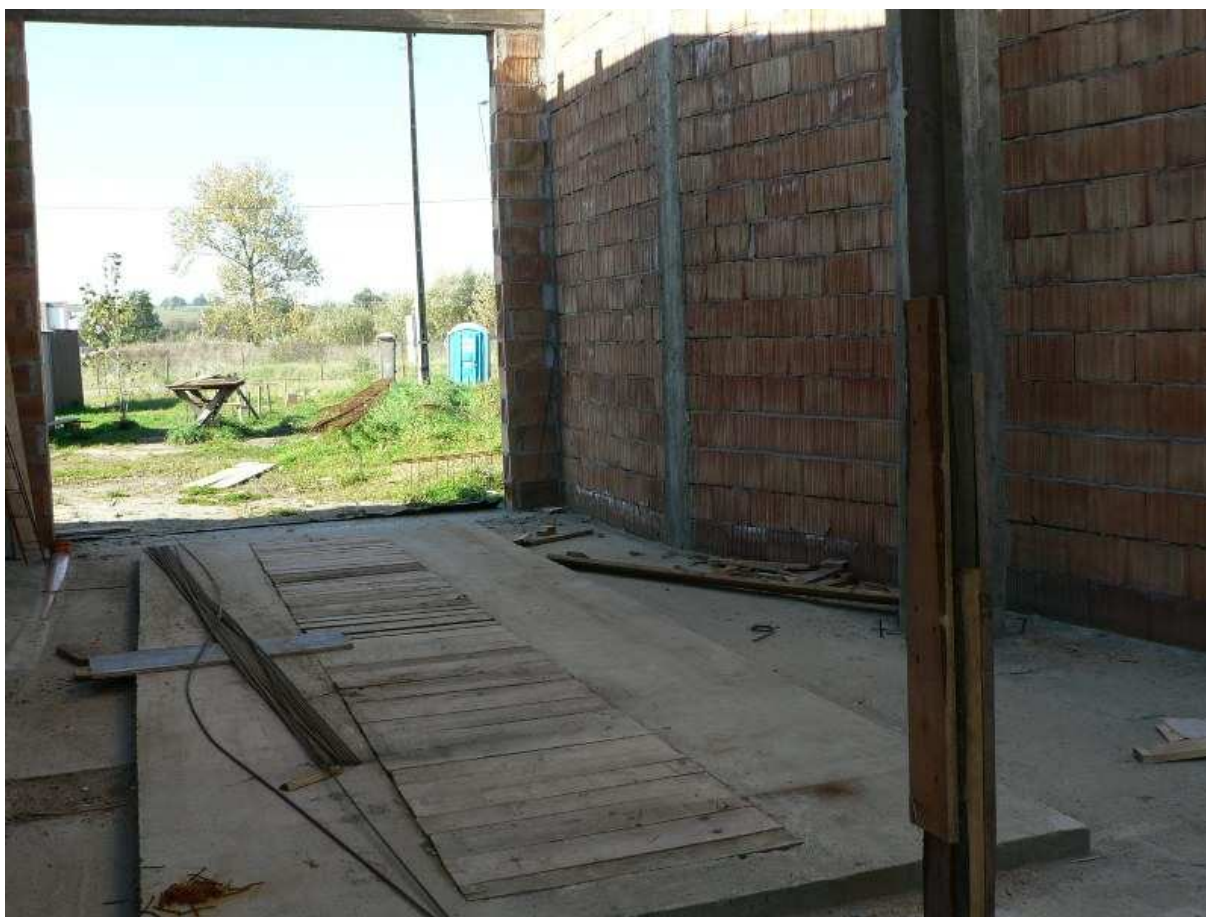
Fot. 5 Garaż z kanałem rewizyjnym – PSP Kazimierza Wielka.