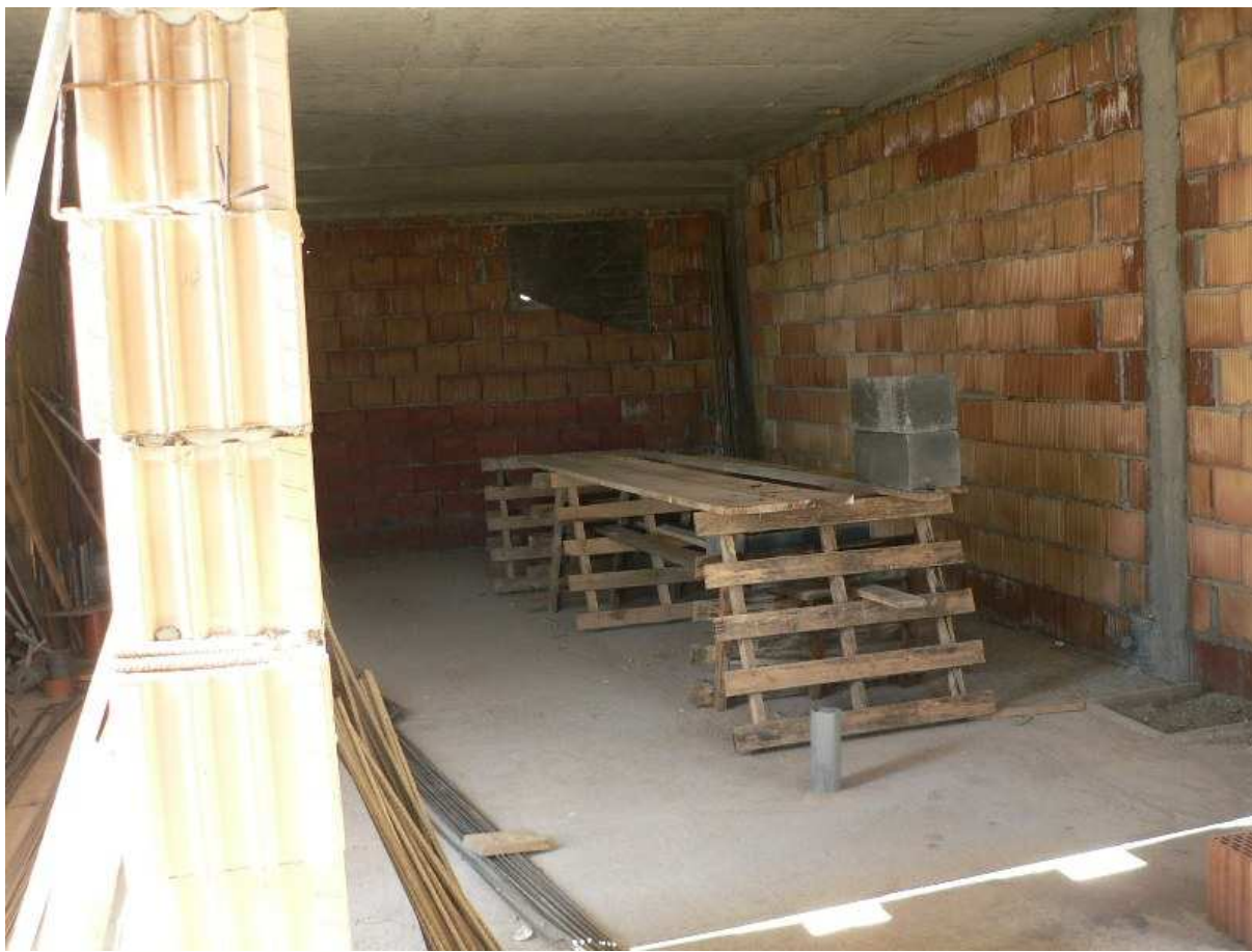
Fot. 6 Pomieszczenia garażowe – PSP Kazimierza Wielka.