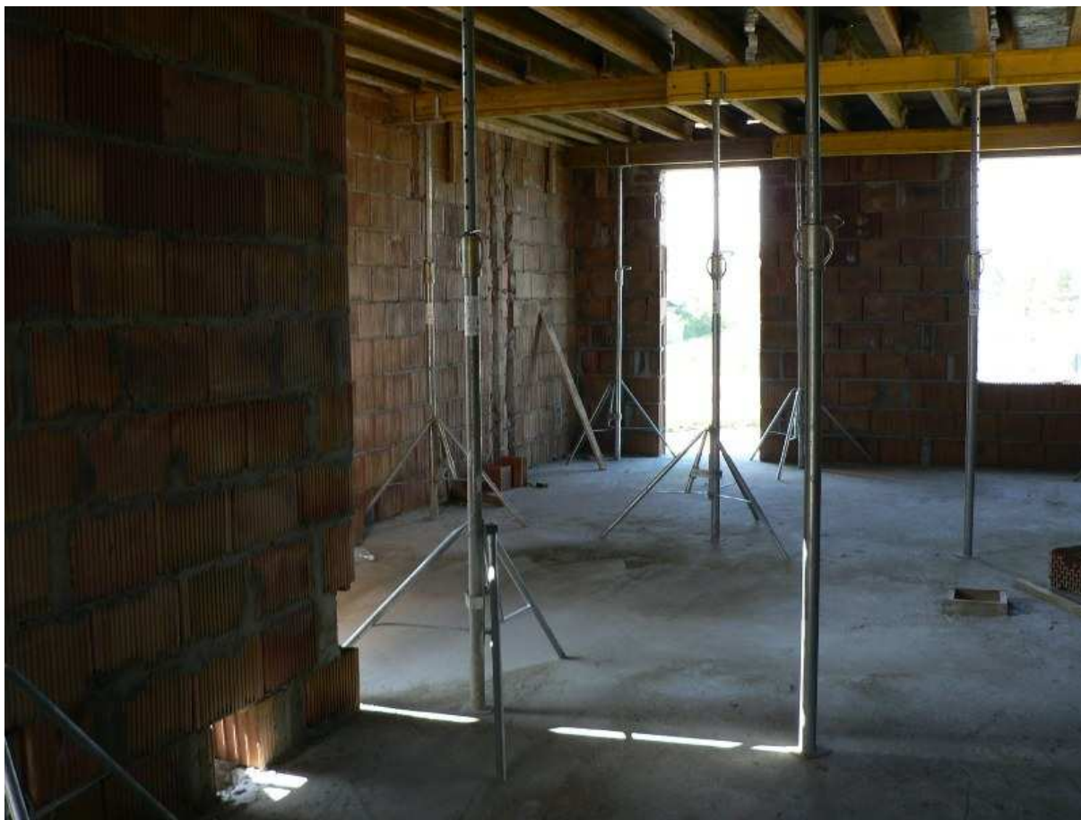
Fot.7 Pomieszczenia szatniowo – sanitarne – PSP Kazimierza Wielka.