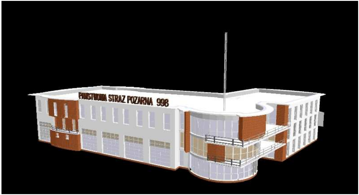
Fot.10 Widok pd-zach od strony Firmy Rolmet. (wizualizacja) – PSP Kazimierza Wielka.