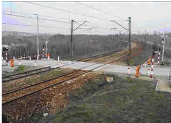
Fot. 14. Tory kolejowe z zaporami i monitoringiem.