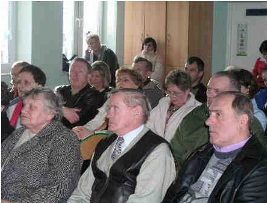
Fot. 2. Zebranie wiejskie 20.04.2008r.