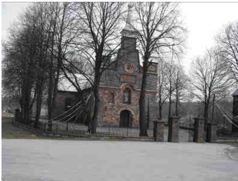
Fot. 16. Zabytkowy Kościół pod wezwaniem św. Szymona i Judy Tadeusza.

Kościół pod wezwaniem św. Szymona i Judy Tadeusza stanowi wizytówkę Kamionek. Parafia w Łącznej powstała w 1913 roku, zaś rok wcześniej rozpoczęto budowę kościoła, którą zakończono w 1920 roku. Obecnie proboszczem jest ks. Jan Marczewski. Mieszkańcy Kamionek artykułują potrzebę iluminacji kościoła, budowy chodnika do niego oraz oświetlenia drogi od kościoła do cmentarza oraz budowy przy nim parkingu.