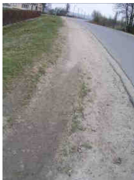
Fot. 20. Brak chodnika wzdłuż drogi, którą uczęszczają dzieci do szkoły.