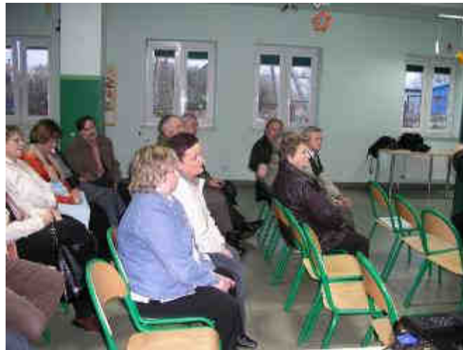
Fot. 18. Zebranie wiejskie w Kamionkach, 20 kwietnia 2008r.