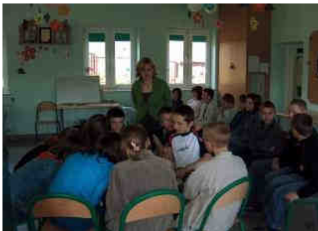
Fot. 10. Świetlica wiejska w Kamionkach w środku.

Na terenie Kamionek podstawową opiekę zdrowotną zapewnia Niepubliczny Zakład Opieki Zdrowotnej w Łącznej (NZOZ od 2005r.), który wcześniej funkcjonował jako zakład publiczny. Funkcjonuje także jedna indywidualna praktyka lekarska. Na terenie miejscowości zlokalizowana jest jedna apteka.