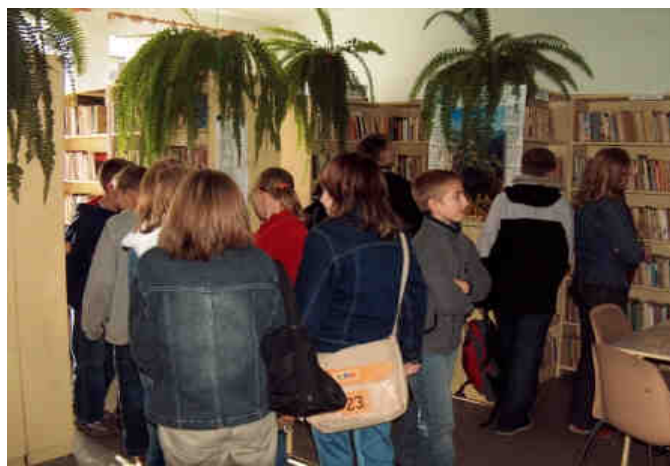
Fot. 11. Gminna Biblioteka Publiczna w Kamionkach.