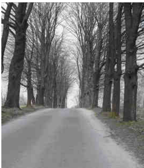
Fot. 8. Aleja lipowa od kościoła do cmentarza.