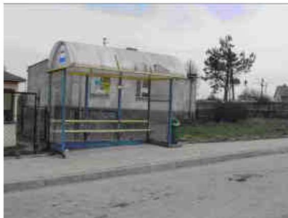
Fot. 13. Przystanek autobusowy w Kamionkach.

Komunikację zbiorową dla całej Gminy zapewnia kolej, linie autobusowe oraz prywatni przewoźnicy. Miejscowość Kamionki charakteryzują się tym, że niedaleko niej z północy na południe, przebiega droga krajowa E7, a wkrótce rozpocznie się budowa jej nowej trasy, tak by spełniała rolę drogi ekspresowej S-7. Droga ta zaliczana jest do sieci dróg międzynarodowych (E77). Ponadto przez Kamionki przebiega linia kolejowa relacji Warszawa - Kielce rozgałęziająca się w kierunku Krakowa i Śląska. Co prawda na terenie Kamionek zlokalizowana jest stacja PKP w Łącznej, ale już od kilku lat jest ona nieczynna. Mieszkańcy Kamionek nie mają problemu z dojazdami do większych miast oddalonych od miejscowości (od Kielc o 20 km, zaś od Skarżyska-Kamiennej o 18-19 km). Na terenie miejscowości znajdują się trzy przystanki autobusowe w tym dwa zadaszone.