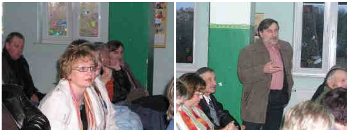
Fot. 5 i 6. Mieszkańcy miejscowości Kamionki podczas Zebrania Wiejskiego w dn. 20 kwietnia 2008r.