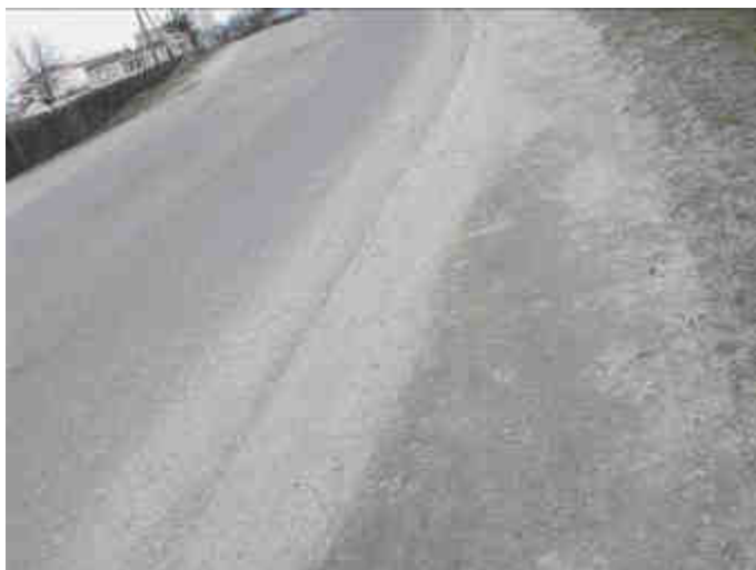
Fot. 21. Brak chodnika wzdłuż drogi dzieci do szkoły.

Planowana inwestycja odgrywać będzie dużą rolę dla społeczności lokalnej, związaną przede wszystkim ze zwiększeniem poczucia jej bezpieczeństwa (chodniki) i sprzyjać będzie nawiązywaniu kontaktów społecznych (plac zabaw, skwer, adaptacja poddasza biblioteki na pomieszczenia do zajęć dydaktyczno-rekreacyjnych). Należy podkreślić, iż zgodnie z interpretacją Ministerstwa Rolnictwa i Rozwoju Wsi 3 w ramach działania „Odnowa i rozwój wsi” możliwe są operacje związane z kształtowaniem przestrzeni publicznej, czyli m.in. budowy parkingów, chodników czy oświetlenia ulicznego, jeżeli znajdują się one w miejscach o szczególnym znaczeniu dla zaspokajania potrzeb mieszkańców, sprzyjających nawiązywaniu kontaktów społecznych, ze względu na cechy funkcjonalno-przestrzenne. Zgodnie z interpretacją MRiRW „(...) centrum miejscowości w rozumieniu przepisów przedmiotowego rozporządzenia nie musi znajdować się w faktycznym centrum miejscowości identyfikowanym na podstawie mapy” 4 .