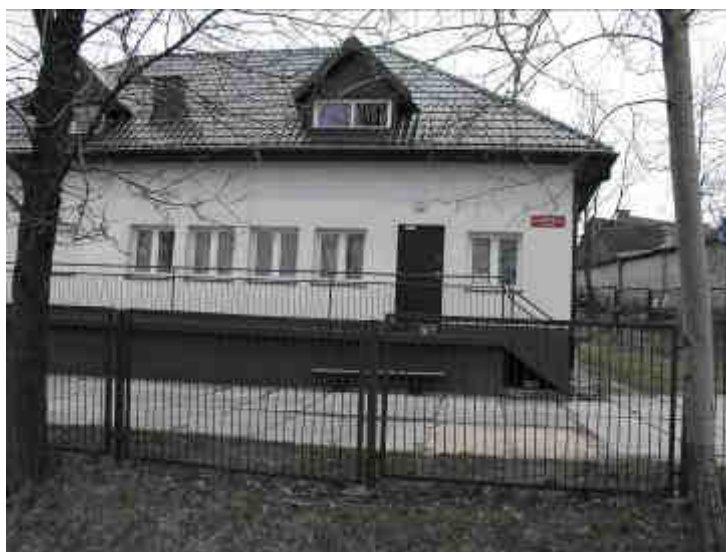
Fot. 9. Biblioteka Gminna z zewnątrz.

Mieszkańcy wiążą duże nadzieje z planowaną budową kompleksu oświatowego. Prace są rozpoczęte. Fundamenty stoją już od lat 90-tych jednak brak środków finansowych spowodował wstrzymanie prac budowlanych. Obecnie Gmina stara się o pozyskanie funduszy unijnych na wznowienie budowy. Kompleks oświatowy będzie obejmował budynek gimnazjum i szkoły podstawowej, łącznik (między kompleksem, a istniejącą salą gimnastyczną). Na terenie powyższego obiektu zaprojektowano boiska sportowe (wielofunkcyjne ogólnodostępne dla dzieci i młodzieży, pełnowymiarowe do piłki nożnej, siatkówki).