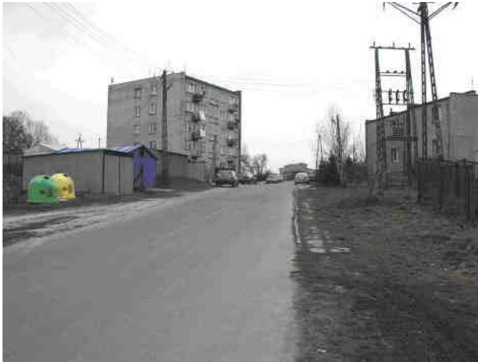
Fot. 7. Blok mieszkalny w miejscowości Kamionki.