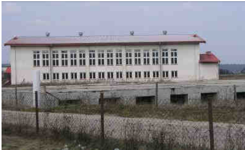
Fot. 19. Sala gimnastyczna wraz z fundamentami pod przyszły kompleks oświatowy.

Rozbudowa infrastruktury edukacyjnej w ramach projektu podporządkowana będzie zapewnieniu równego dostępu do edukacji dobrej jakości dla dzieci i młodzieży z terenów wiejskich, na których znajduje się Gmina Łączna.