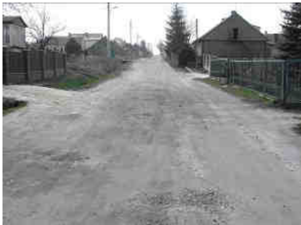
Fot. 12. Droga powiatowa Kamionki - Czerwona Górką - Jęgrzna w miejscowości Kamionki.