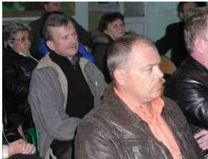
Fot. 17. Zebranie wiejskie w Kamionkach, 20 kwietnia 2008r.