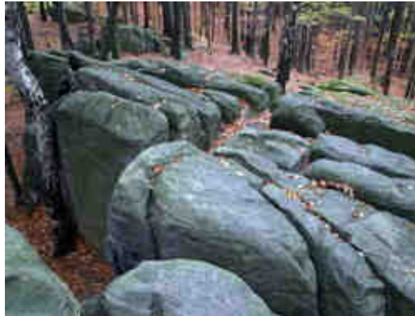
Fot. 3. Bukowa Góra.

Przez teren gminy przebiega pasmo Klonowskie Gór Świętokrzyskich, które rozciąga się od Zagnańska w dolinie Bobrzy na zachodzie, po okolice Bodzentyna na wschodzie. Pasma to jest zbudowane głównie z piaskowców i kwarcytów dewońskich. Głównym szczytem tego pasma jest Góra Bukowa (484 m).