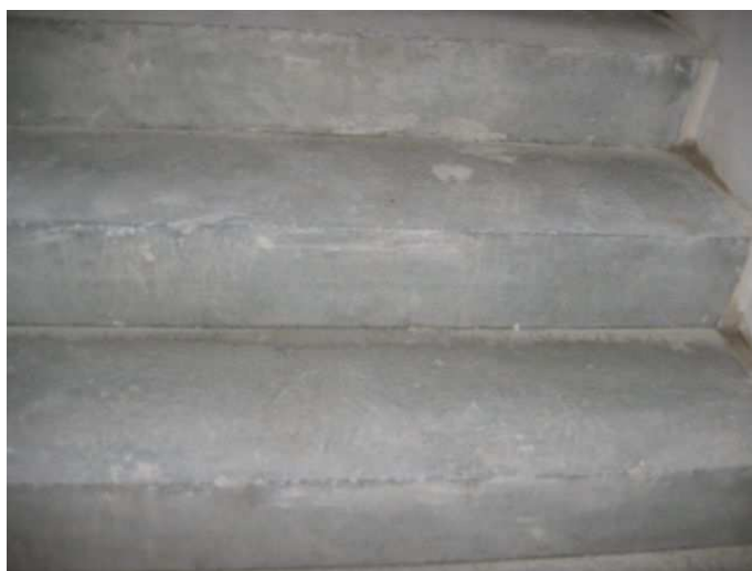
Zdj.8 Schody – wysoki parter.