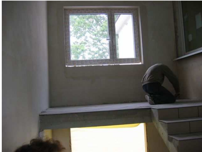
Zdj. 3 Schody, kondygnacja drugiego piętra, klatka zewnętrzna, północna.