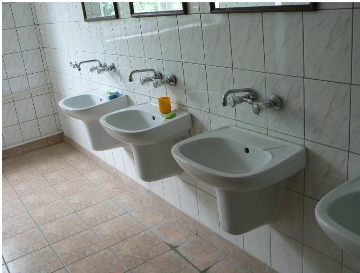
Zdj.15 Pomieszczenia sanitarne.