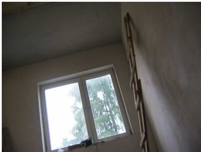
Zdj.9 II kondygnacja klatki schodowej, północnej.