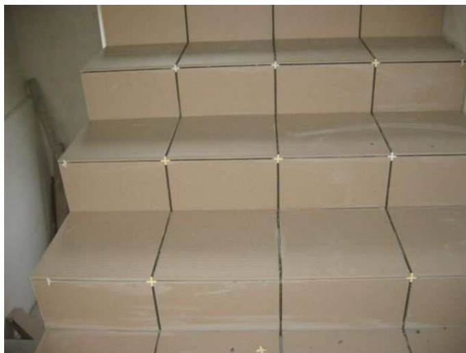
Zdj. 1 Bieg schodów w wyłożonej glazurze ( klatka zewnętrzna - północna)

W trakcie przeprowadzonej kontroli w dniu 29 maja 2009r. zostały wykonane zdjęcia, które lokalizują i potwierdzają stopień zaawansowania inwestycji.