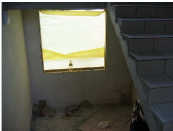
Zdj.5 Schody z półpiętra w klatce zewnętrznej.