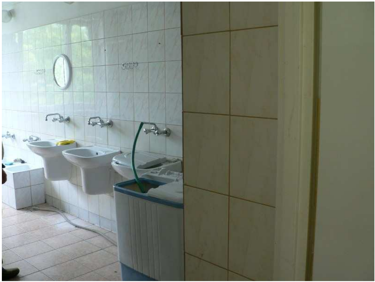
Zdj.12 Pomieszczenie łazienkowe w budynku głównym.