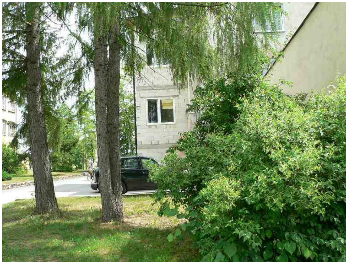
Zdj. 11 W tle widok klatki schodowej zewnętrznej, północnej.