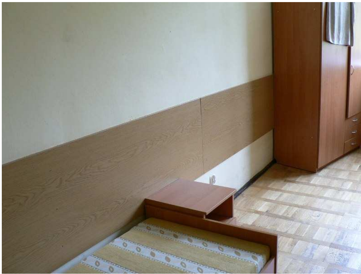
Zdj.14 Pokoje wychowanków w budynku głównym.