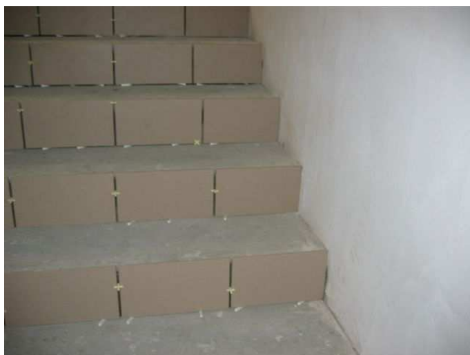
Zdj.6 Schody z półpiętra w klatce zewnętrznej.