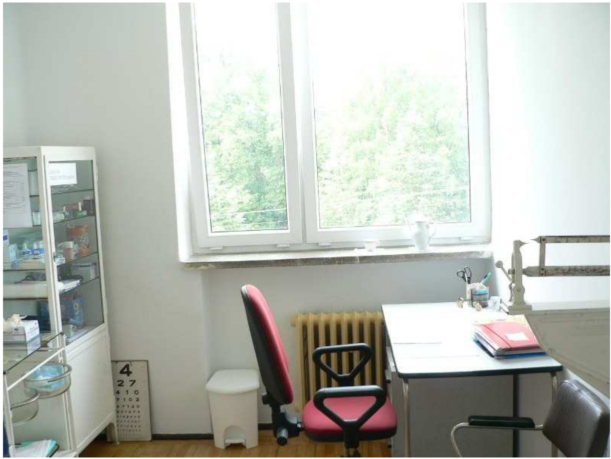
Zdj. 13 Pokój lekarski w budynku głównym.