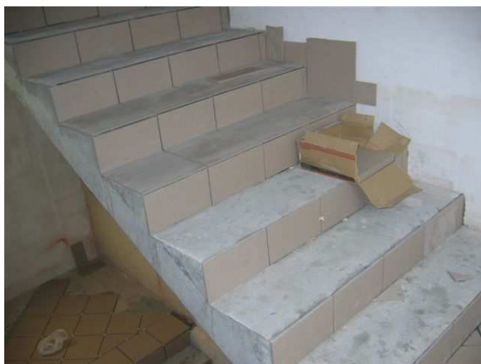
Zdj.2 Bieg schodów w częściowej glazurze ( wejście na piętro – klatka zewnętrzna - północna)