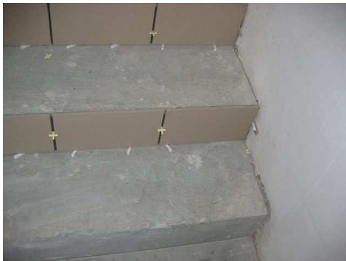
Zdj.7 Schody z półpiętra w klatce zewnętrznej.