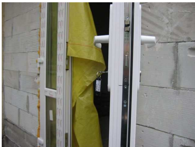
Zdj.10 Drzwi wejściowe na klatkę północną zewnętrzną.