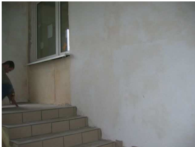
Zdj.4 Schody, kondygnacja drugiego piętra, klatka zewnętrzna, północna.