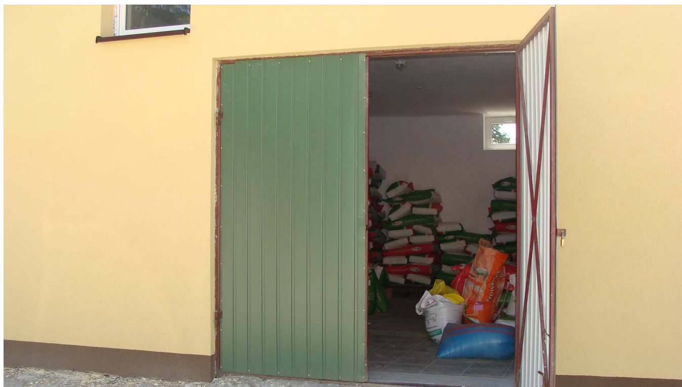
Fot. 25 Pomieszczenia gospodarcze w budynku garaży Powiatowego Inspektoratu Weterynarii w Busku - Zdroju