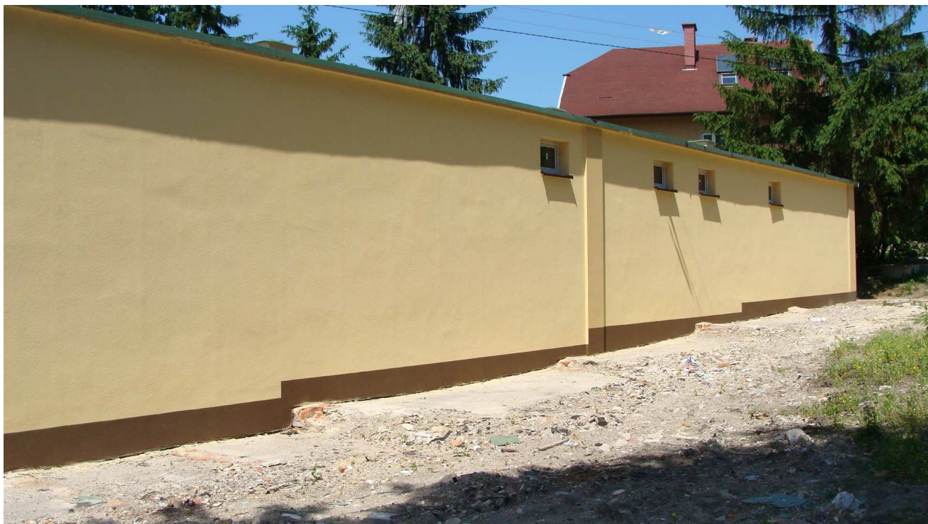
Fot. 10 Budynek garaży Powiatowego Inspektoratu Weterynarii w Busku - Zdroju