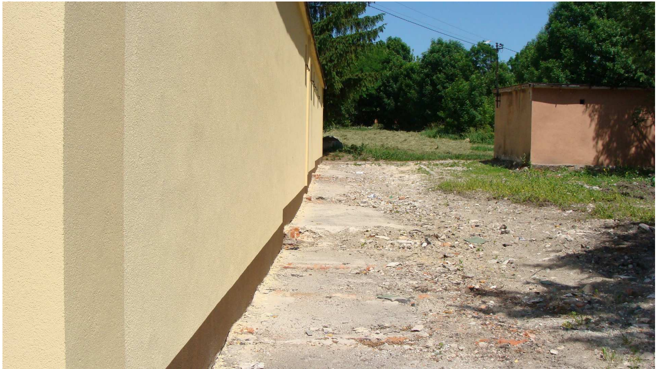
Fot. 9 Budynek garaży Powiatowego Inspektoratu Weterynarii w Busku – Zdroju (miejsce po rozbiórce przybudówki)