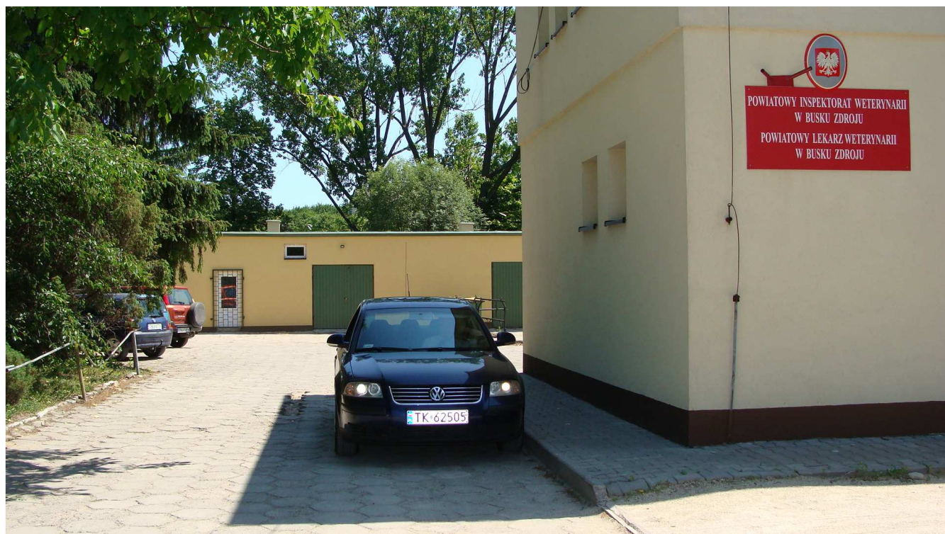
Fot.1 Powiatowy Inspektorat Weterynarii w Busku – Zdroju (w tle budynek garaży)

W trakcie przeprowadzonej kontroli potwierdzono rzeczową realizację projektu zgodnie z zakresem rzeczowym inwestycji.