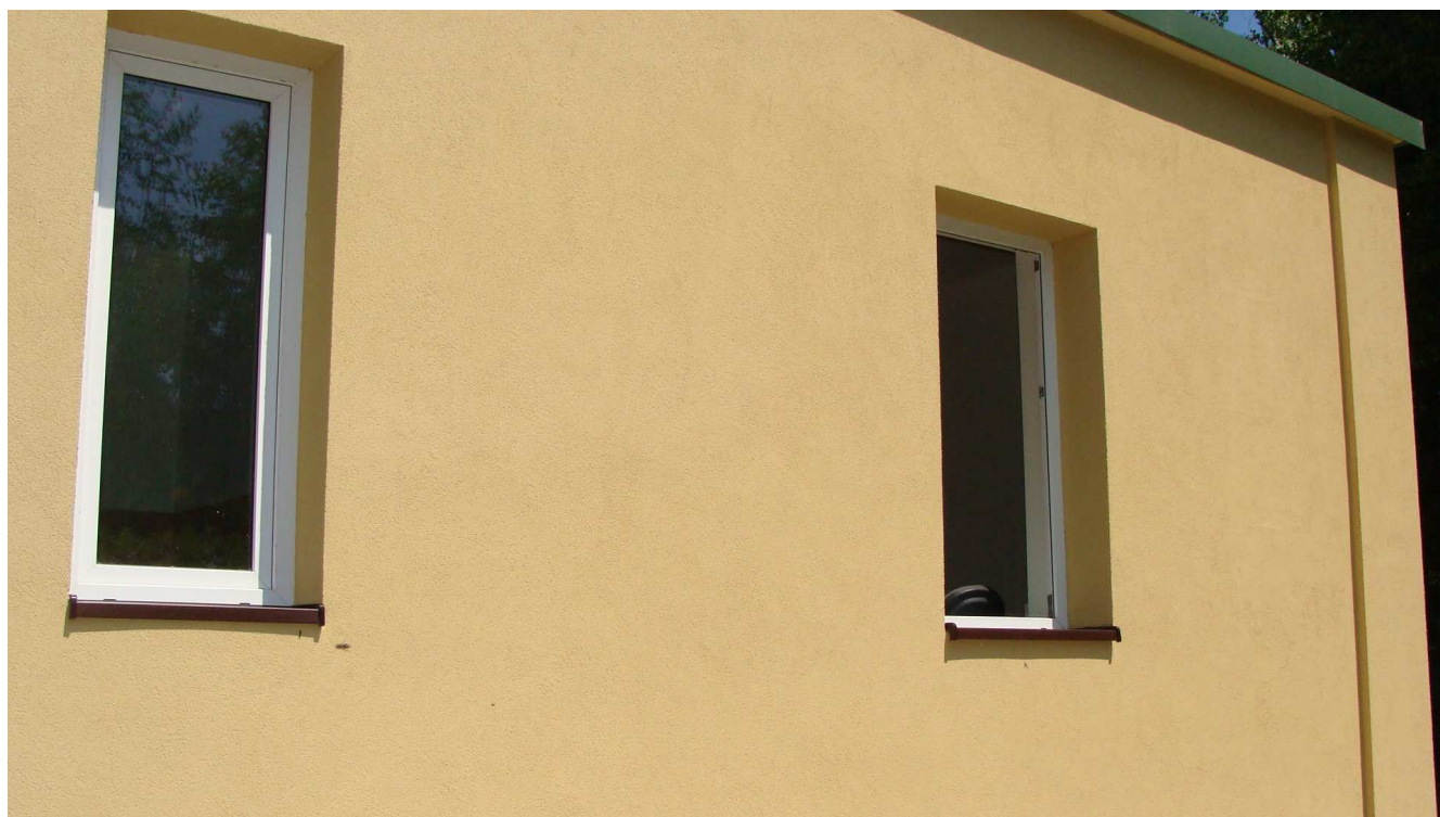
Fot. 8 Budynek garaży Powiatowego Inspektoratu Weterynarii w Busku - Zdroju