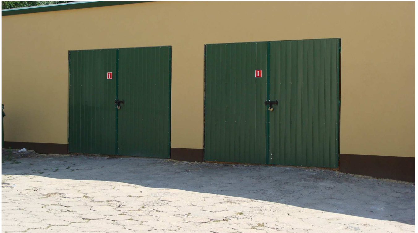
Fot. 5 Budynek garaży Powiatowego Inspektoratu Weterynarii w Busku - Zdroju