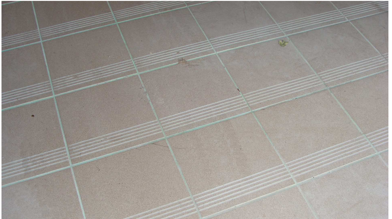
Fot. 12 Posadzki w garażu Powiatowego Inspektoratu Weterynarii w Busku - Zdroju