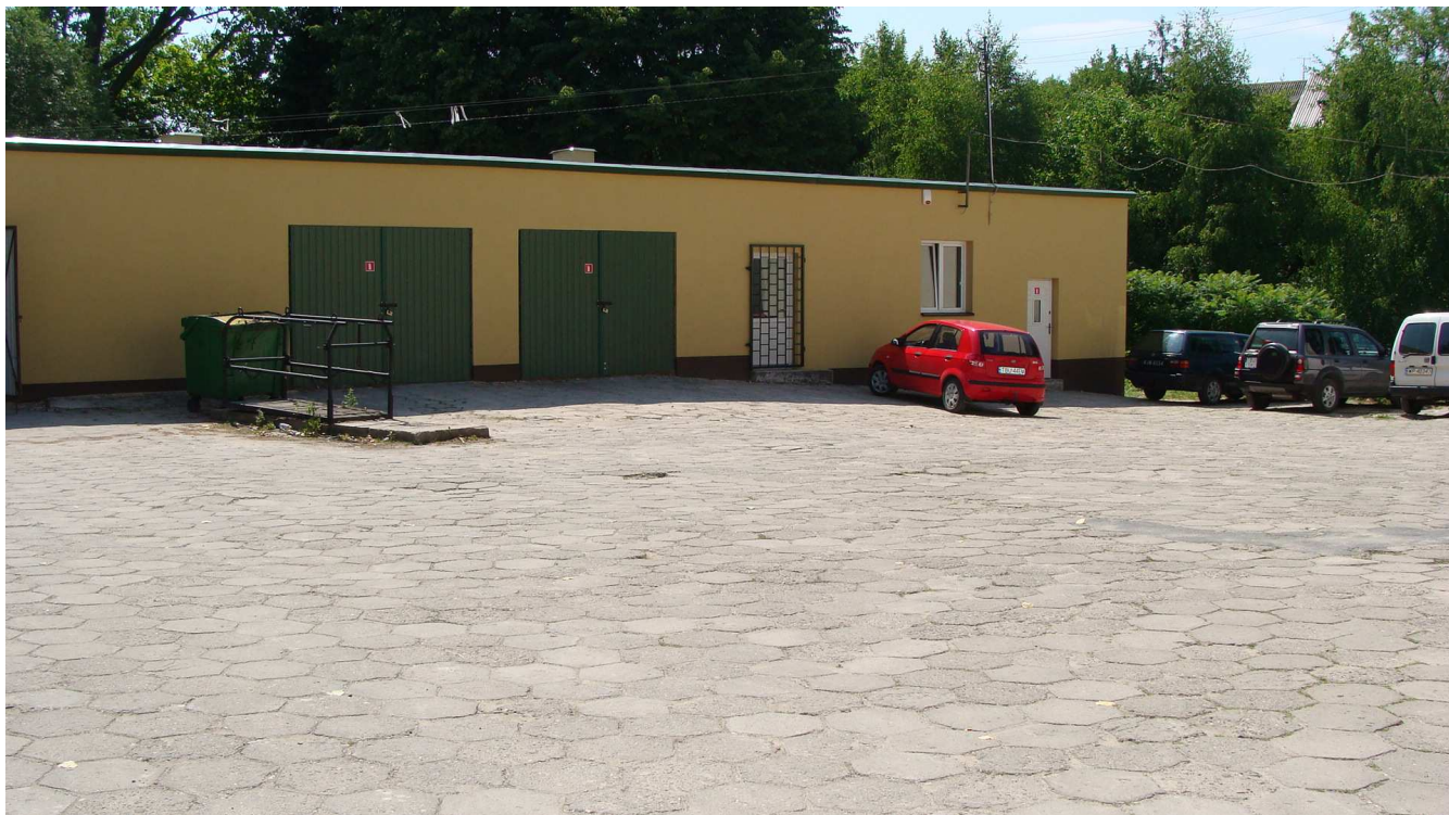
Fot. 4 Budynek garaży Powiatowego Inspektoratu Weterynarii w Busku - Zdroju