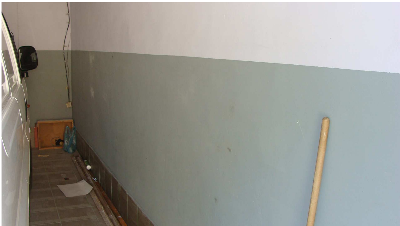
Fot. 13 Garaż Powiatowego Inspektoratu Weterynarii w Busku - Zdroju