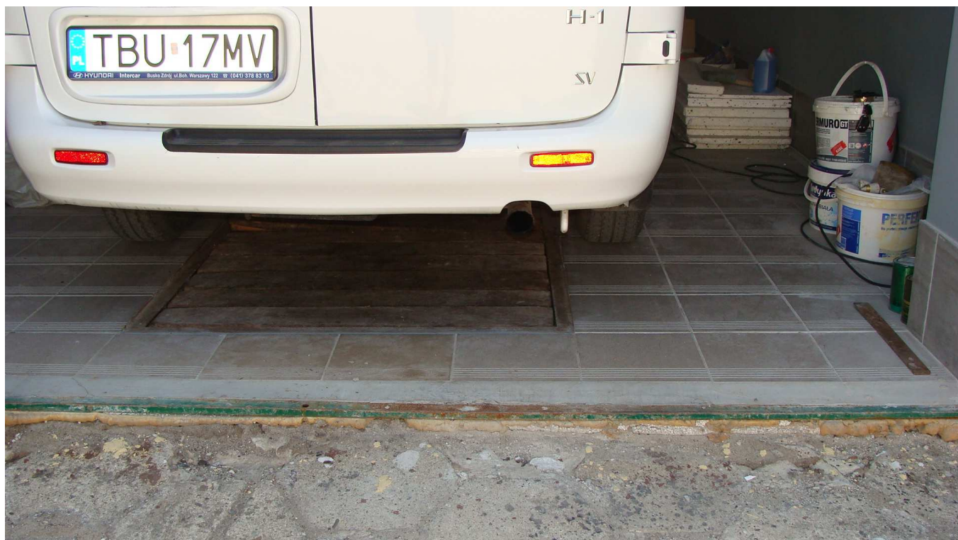
Fot. 16 Posadzki w budynku garaży Powiatowego Inspektoratu Weterynarii w Busku - Zdroju