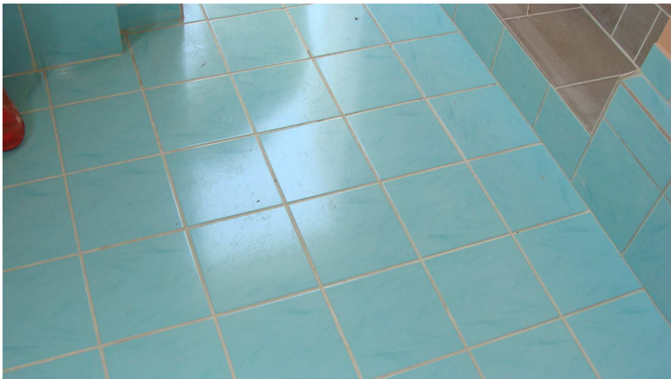
Fot. 23 Posadzka w pomieszczeniach gospodarczych w budynku garaży Powiatowego Inspektoratu Weterynarii w Busku – Zdroju