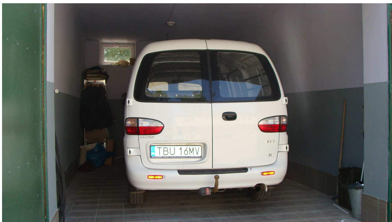
Fot. 11 Garaż Powiatowego Inspektoratu Weterynarii w Busku - Zdroju