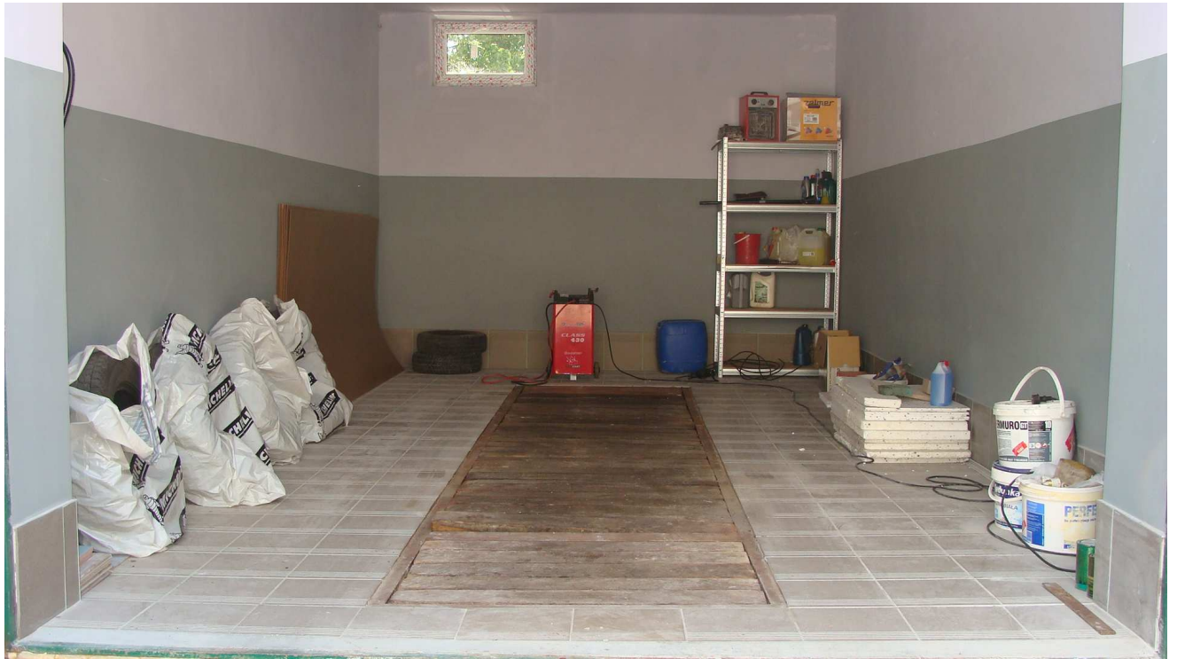
Fot. 20 Garaż Powiatowego Inspektoratu Weterynarii w Busku - Zdroju