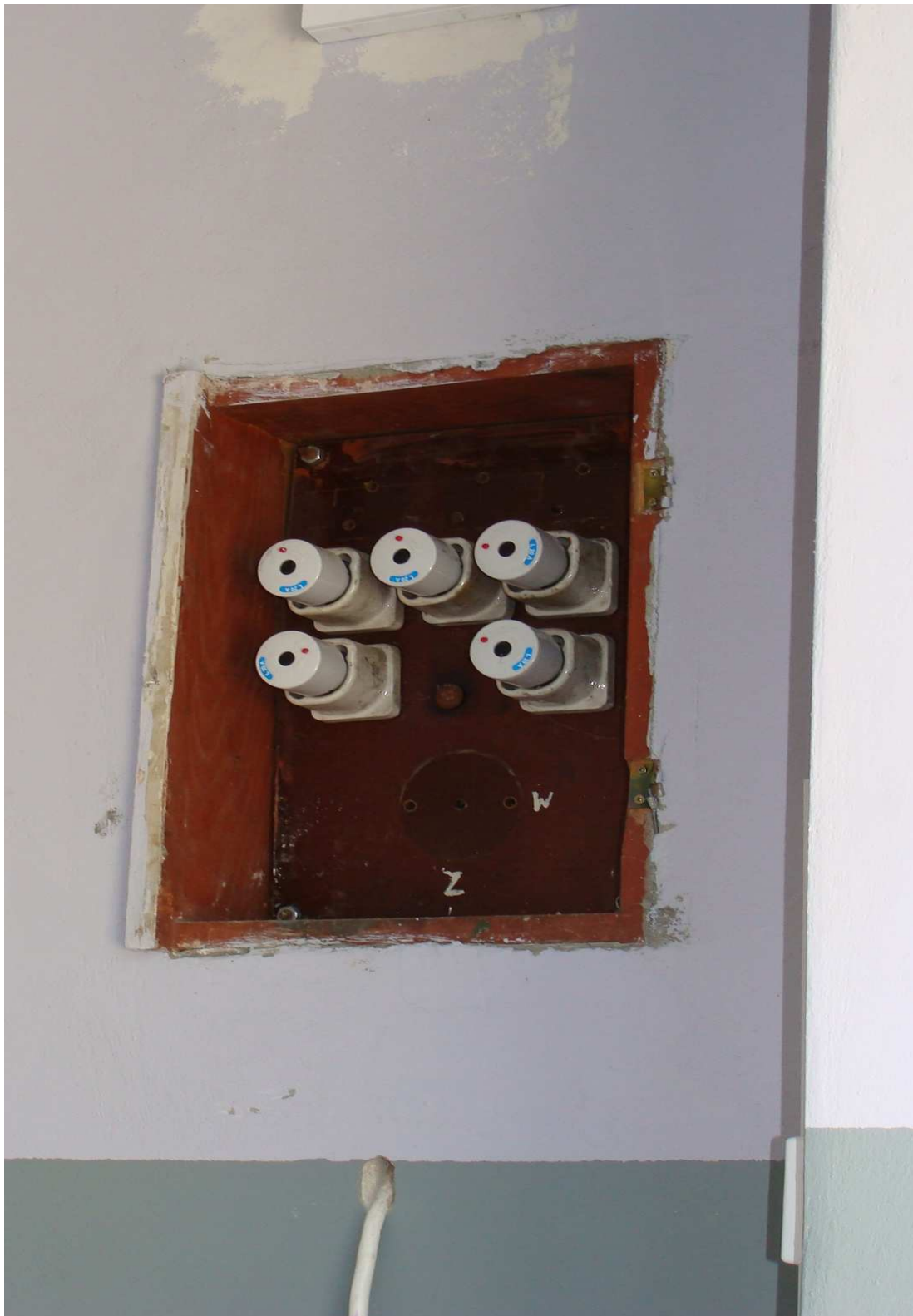
Fot. 17 Instalacja elektryczna w budynku garaży Powiatowego Inspektoratu Weterynarii w Busku - Zdroju