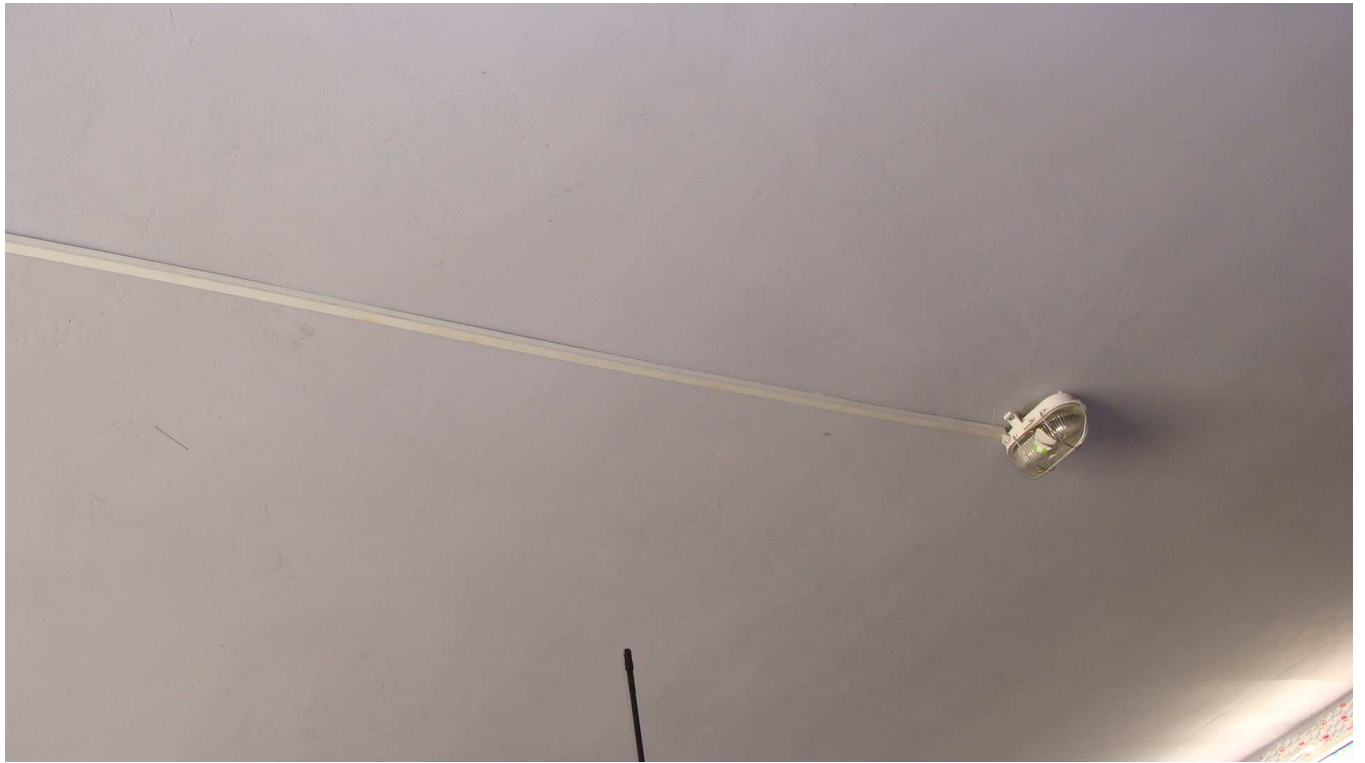
Fot. 15 Instalacja elektryczna w budynku garaży Powiatowego Inspektoratu Weterynarii w Busku - Zdroju