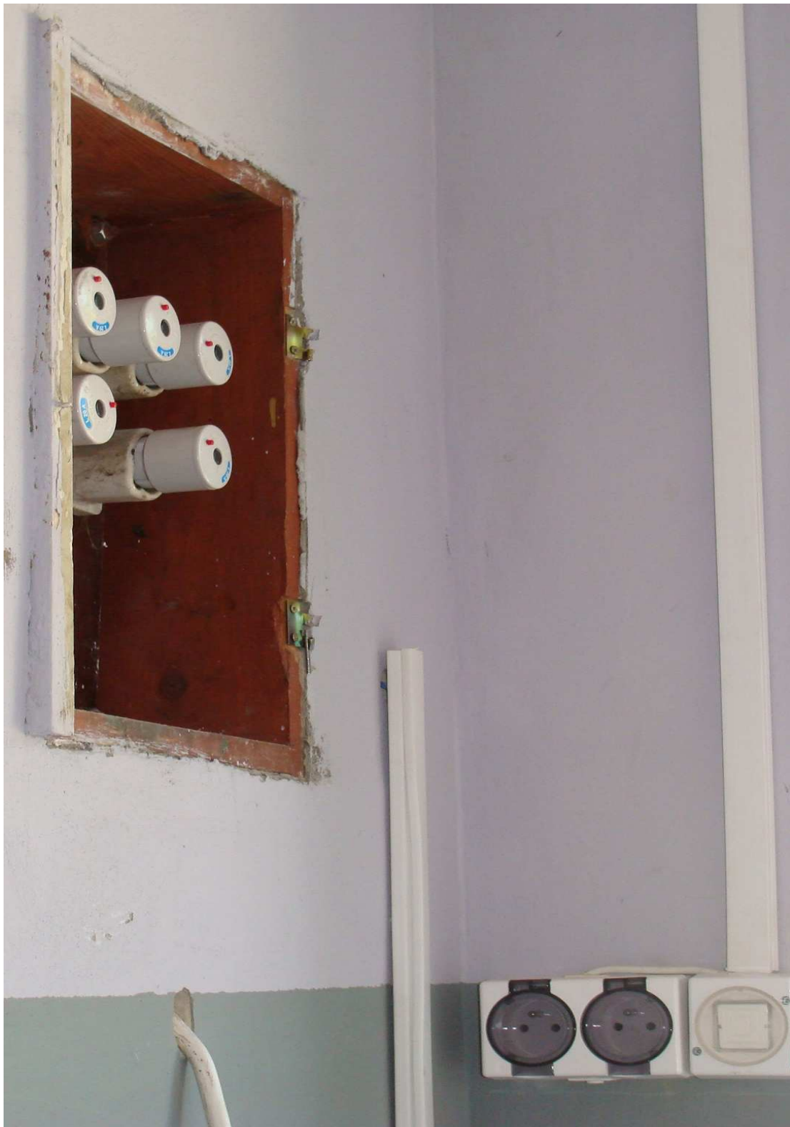
Fot. 18 Instalacja elektryczna w budynku garaży Powiatowego Inspektoratu Weterynarii w Busku - Zdroju