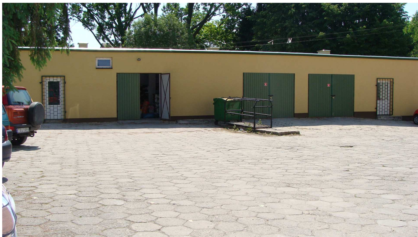
Fot. 3 Budynek garaży Powiatowego Inspektoratu Weterynarii w Busku - Zdroju