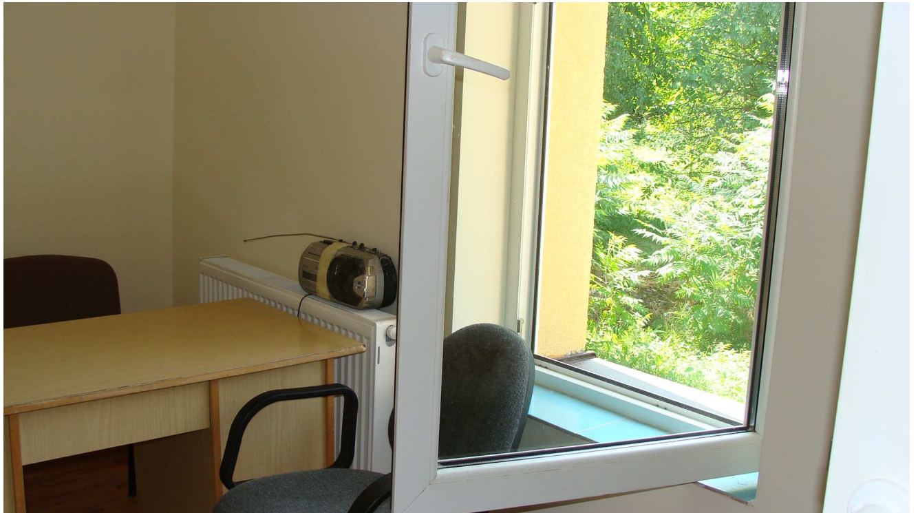
Fot. 22 Pomieszczenia gospodarcze w budynku garaży Powiatowego Inspektoratu Weterynarii w Busku - Zdroju