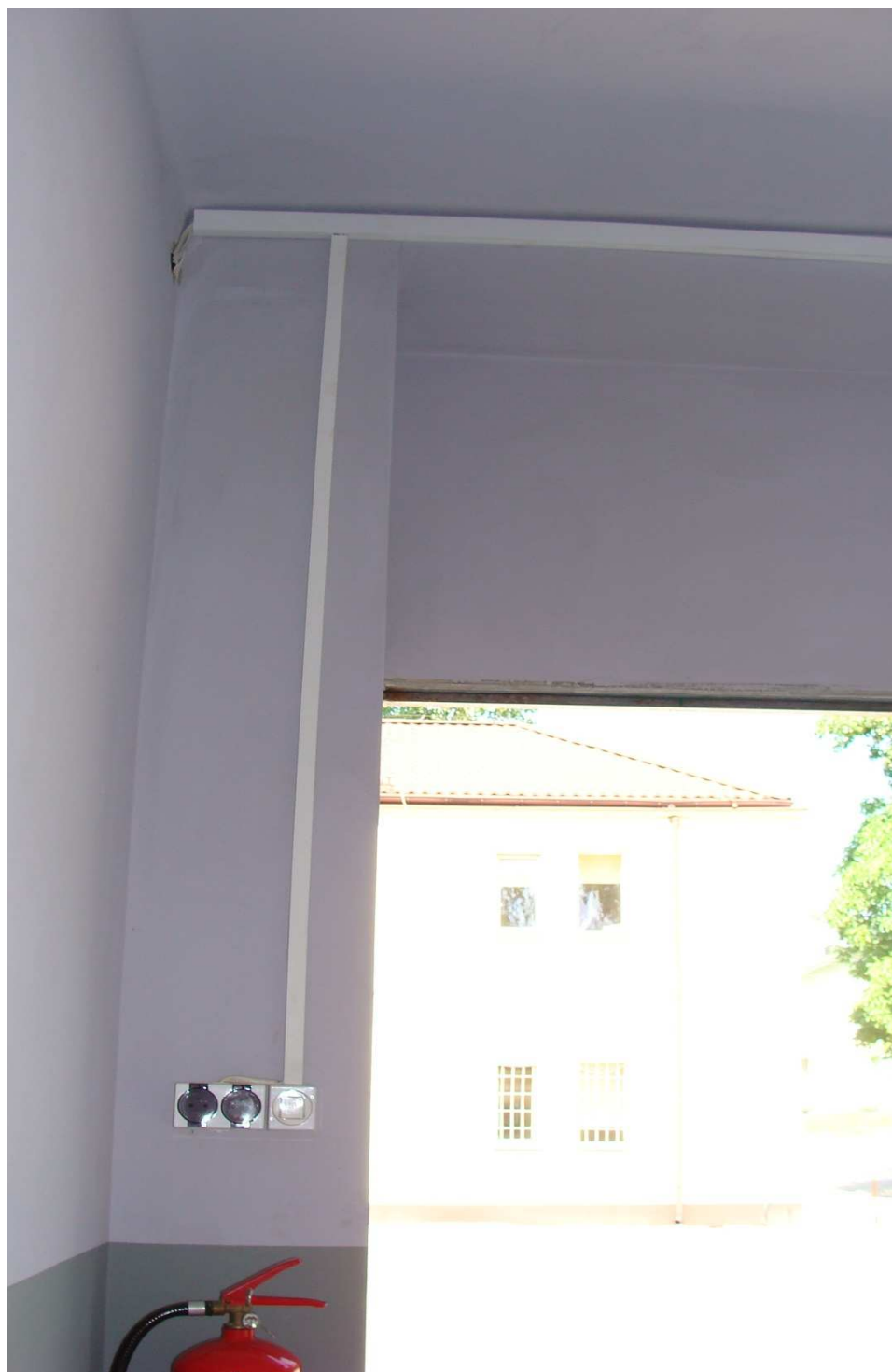
Fot. 14 Instalacja elektryczna w budynku garaży Powiatowego Inspektoratu Weterynarii w Busku - Zdroju