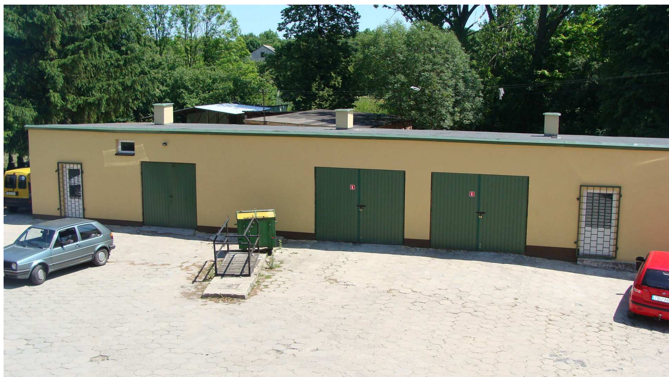
Fot. 7 Budynek garaży Powiatowego Inspektoratu Weterynarii w Busku - Zdroju