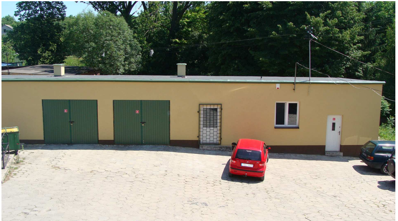
Fot. 6 Budynek garaży Powiatowego Inspektoratu Weterynarii w Busku - Zdroju