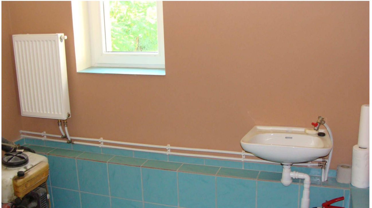
Fot. 21 Pomieszczenia gospodarcze w budynku garaży Powiatowego Inspektoratu Weterynarii w Busku - Zdroju