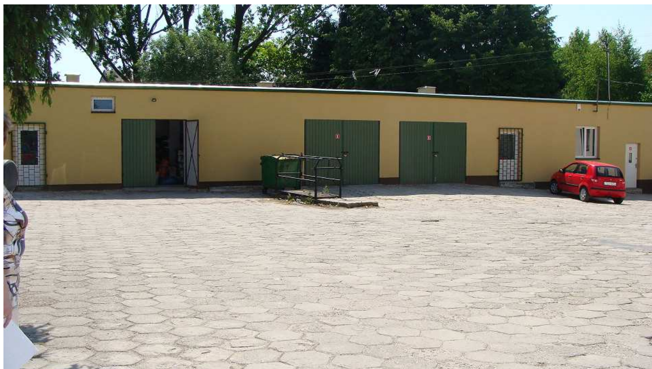
Fot. 2 Budynek garaży Powiatowego Inspektoratu Weterynarii w Busku - Zdroju