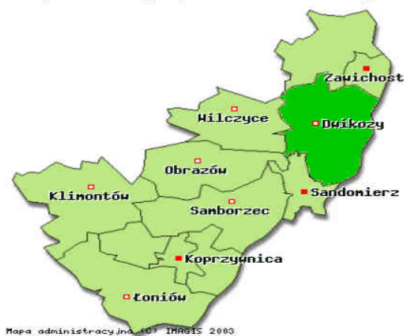
Rysunek 1. Mapa powiatu sandomierskiego

Dwikozy Gmina Dwikozy położona jest w południowo-wschodniej części powiatu. Częściowo leży w dolinie rzek Wisły i Opatówki, w przeważającej zaś części na Wyżynie Sandomierskiej wchodzącej w skład Wyżyny Kieleckiej. Na koniec 2007r. na terenie gminy zamieszkiwało 9 337 osób, co stawiało ją na 3 miejscu w powiecie. Gmina zajmuje powierzchnię 8 560 ha, co stawia ją na 3 miejscu w powiecie. Z ogólnej powierzchni, 7 048 ha stanowią użytki rolne (ok. 83 %),