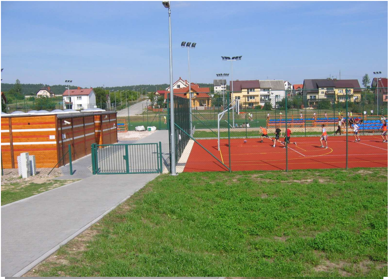
Zdj.1 Wejście na teren boisk sportowych. W tle pomieszczenia socjalne - kontenery szatniowo – sanitarne.