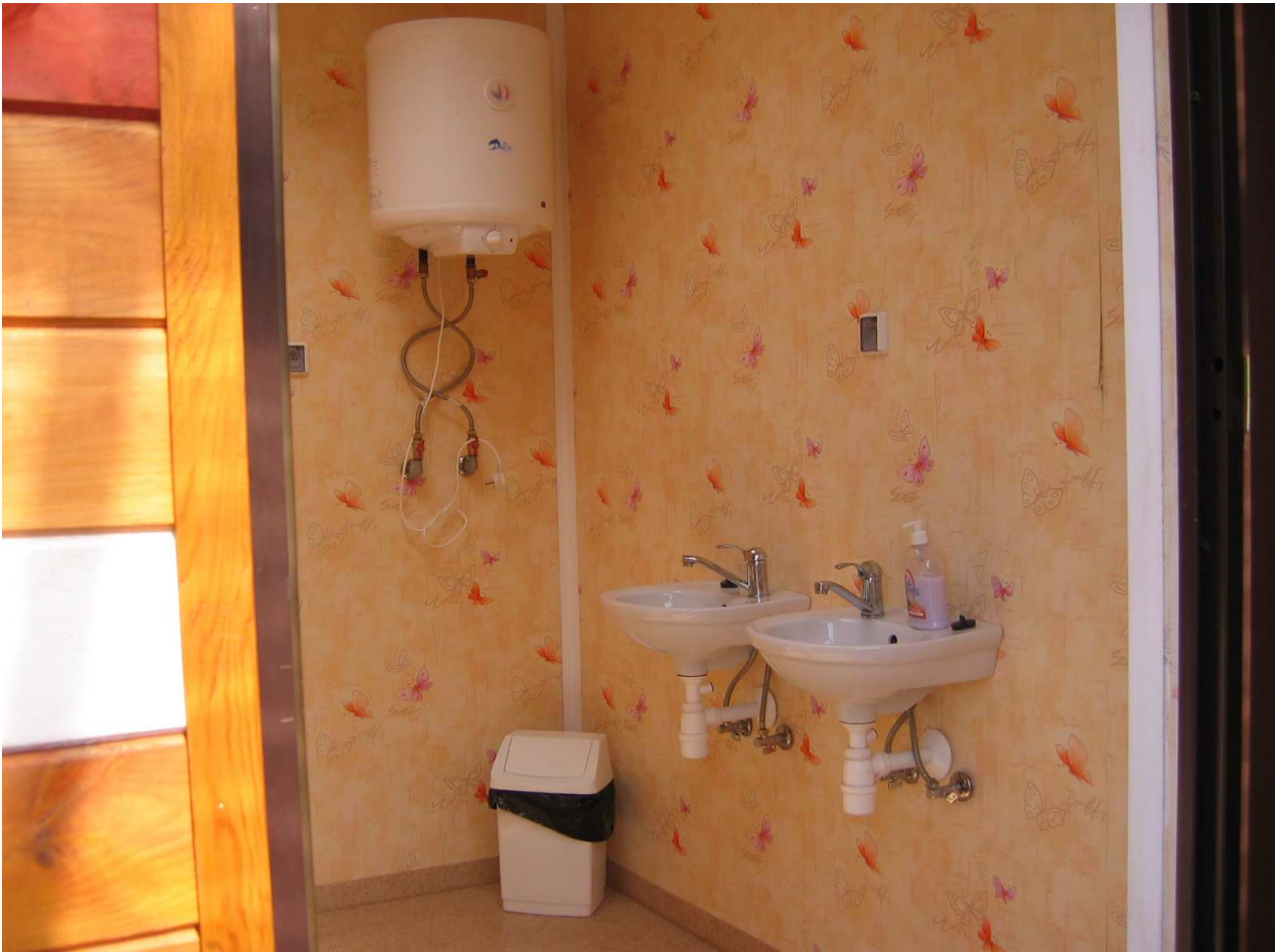
Zdj.6 Kontenery - Wnętrze pomieszczenia szatniowo-sanitarnego