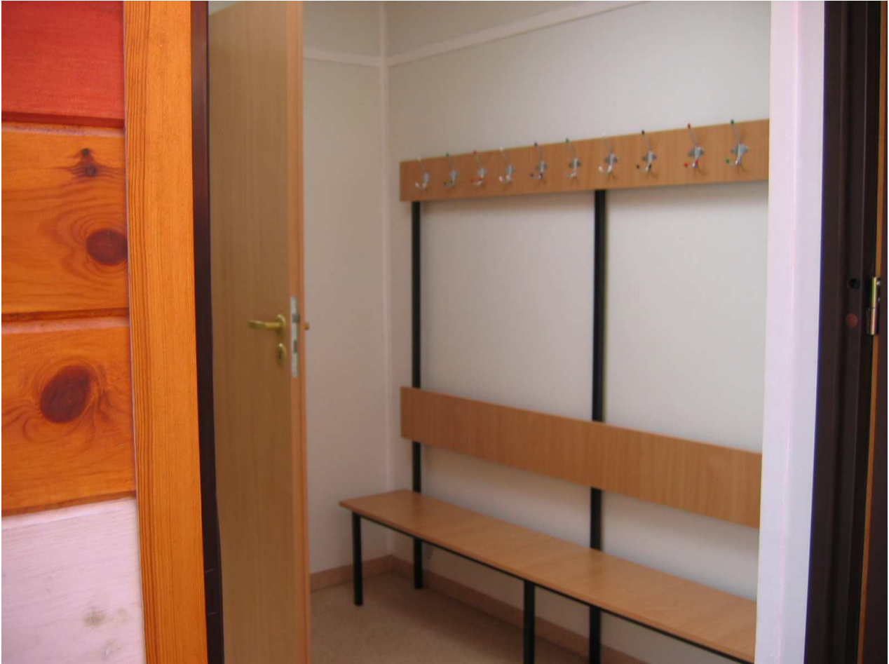
Zdj.7 Kontenery - Wnętrze pomieszczenia szatniowo-sanitarnego