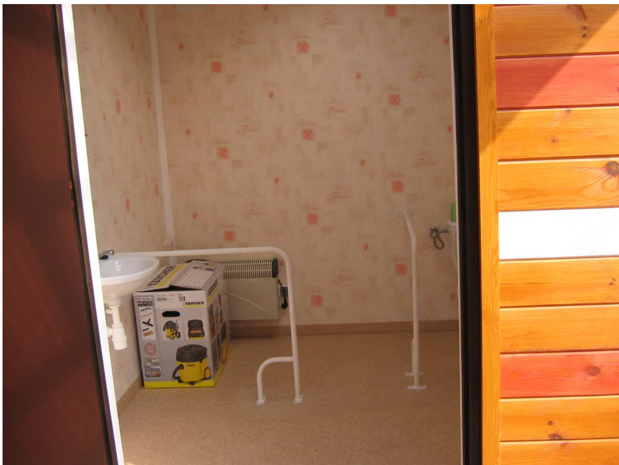
Zdj.5 Kontenery - Wnętrze pomieszczenia szatniowo-sanitarnego