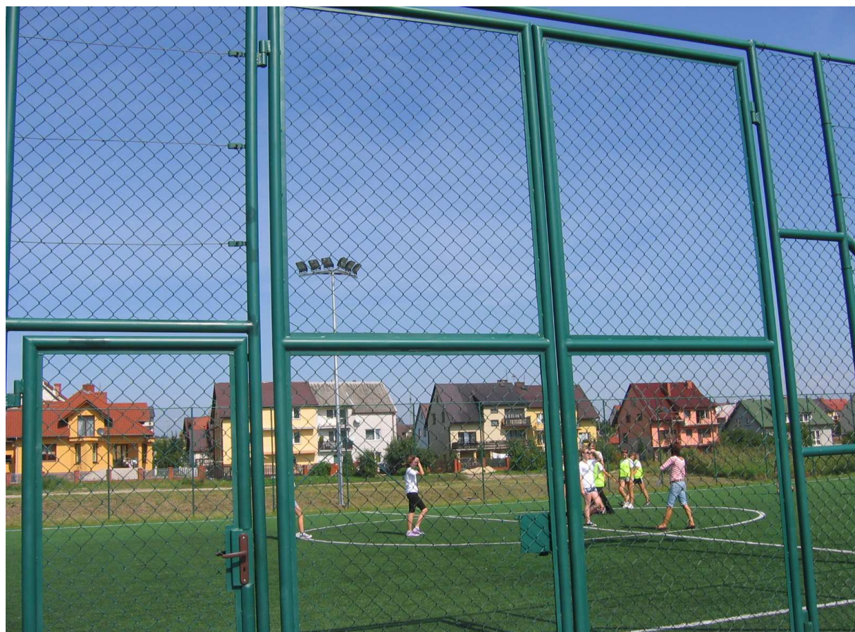
Zdj.2 Boisko o nawierzchni wykonanej z trawy sztucznej wraz z oświetleniem.