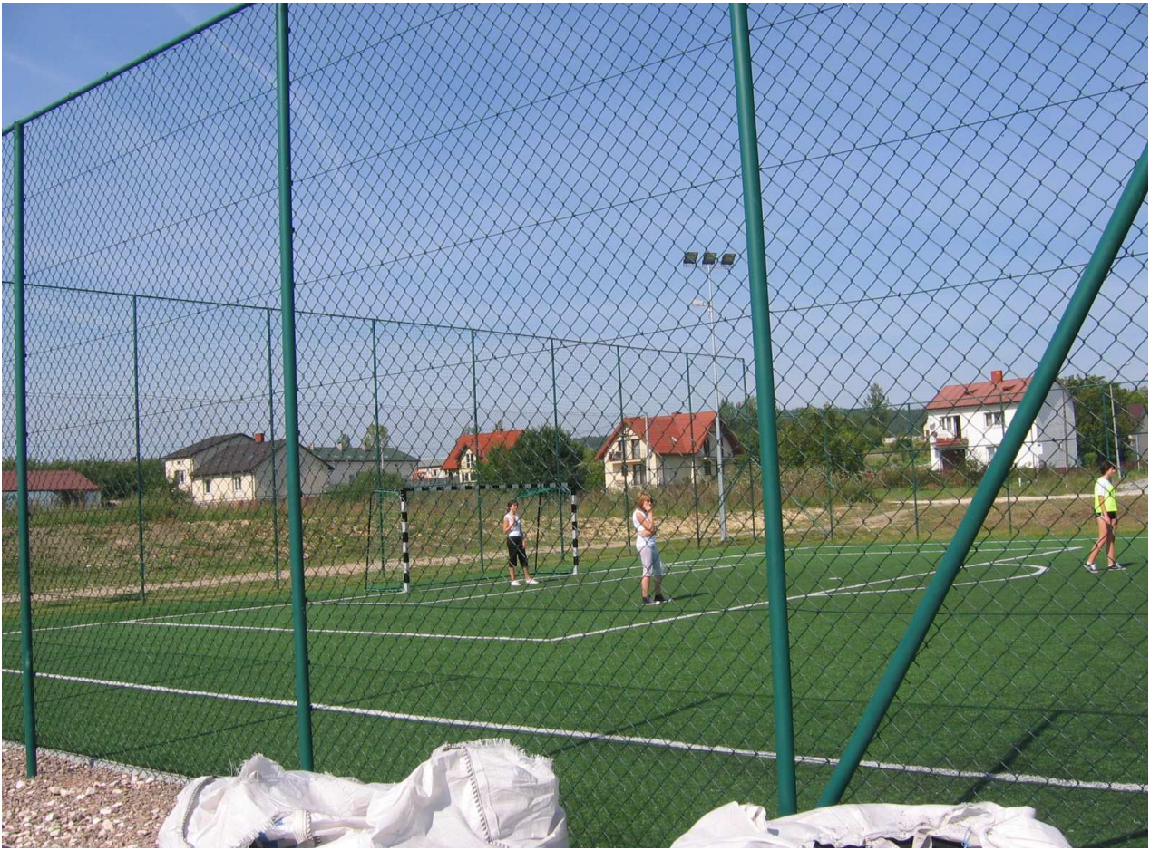
Zdj.3 Boisko o nawierzchni wykonanej z trawy sztucznej wraz z ogrodzeniem i oświetleniem.