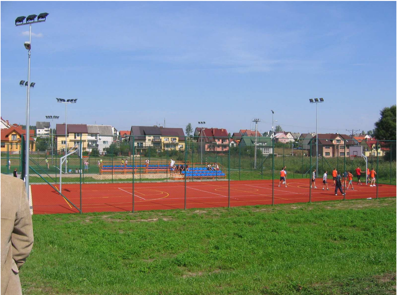
Zdj.4 Boisko o nawierzchni poliuretanowej wraz z ogrodzeniem i oświetleniem.