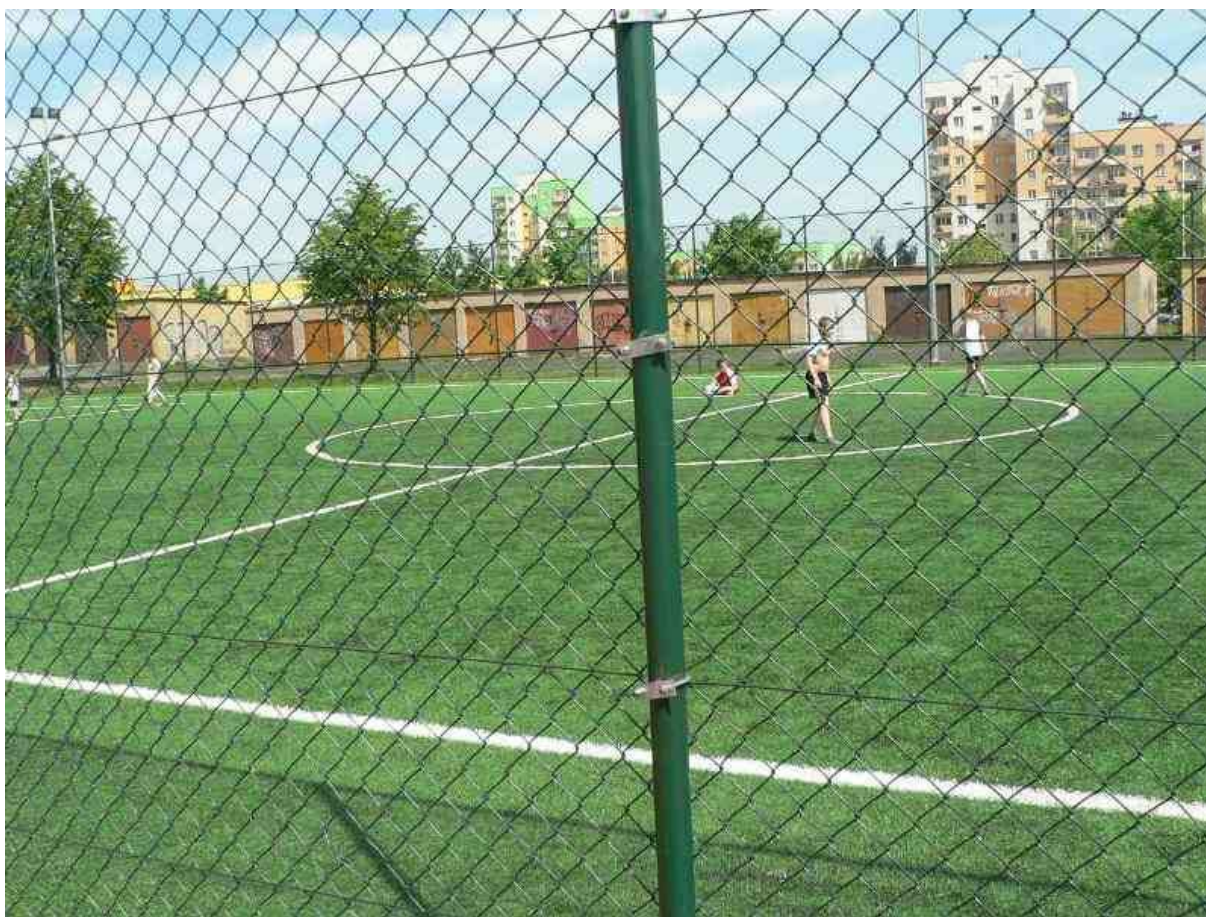
Zdj.3 Boisko o nawierzchni wykonanej z trawy sztucznej.