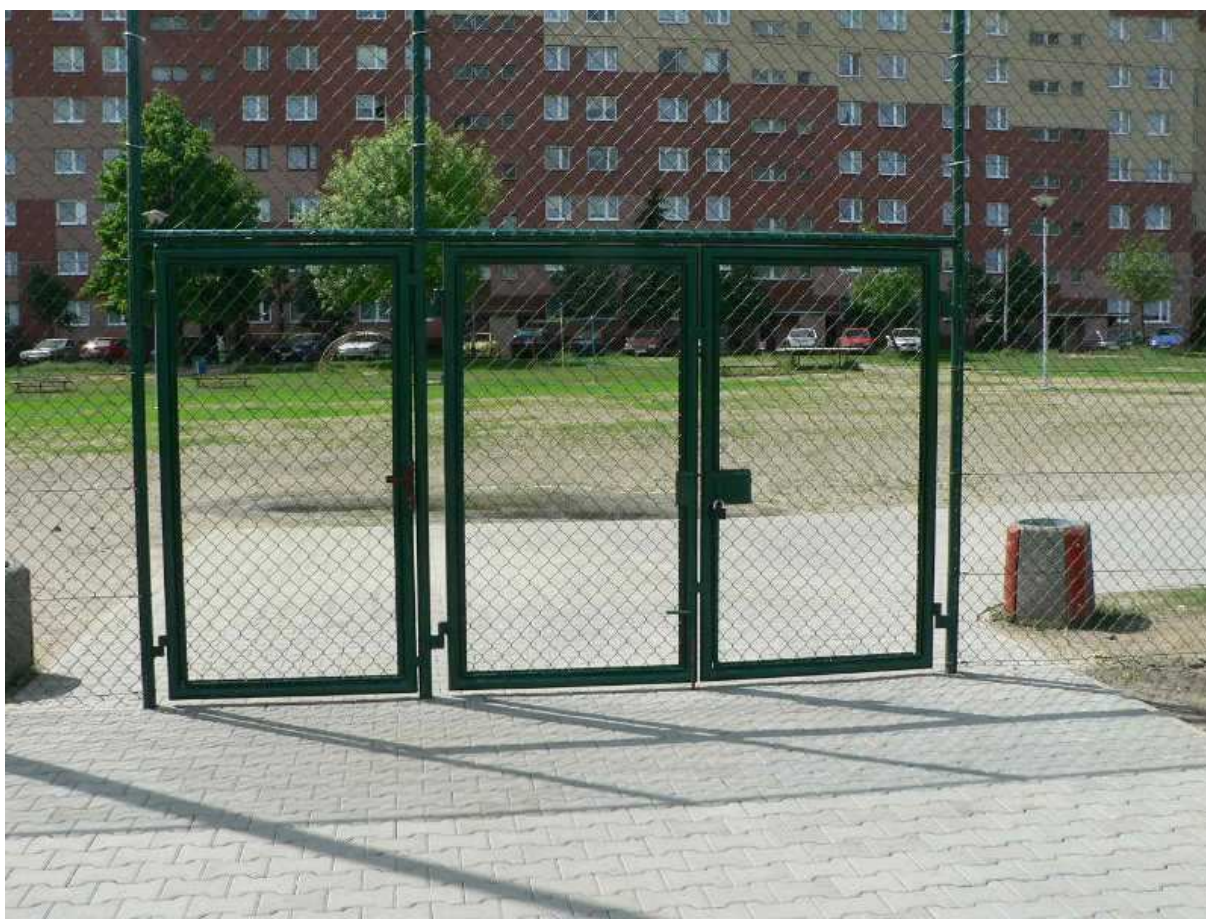
Zdj.1 Wejście na teren boisk sportowych.

W trakcie przeprowadzonej kontroli zostały zaprezentowane boiska oraz wykonane zdjęcia, które lokalizują i potwierdzają istnienie inwestycji.