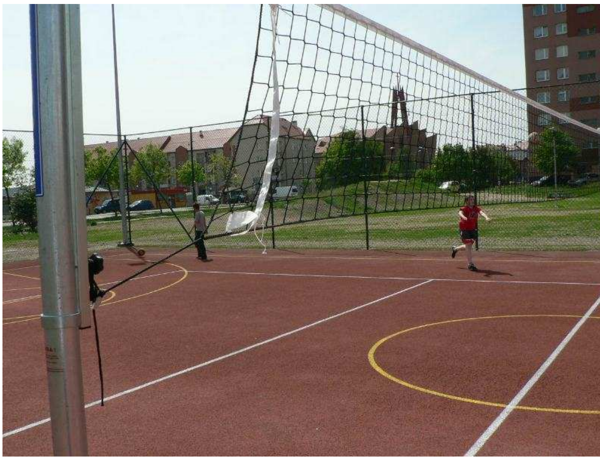
Zdj.2 Boisko z nawierzchni poliuretanowej.