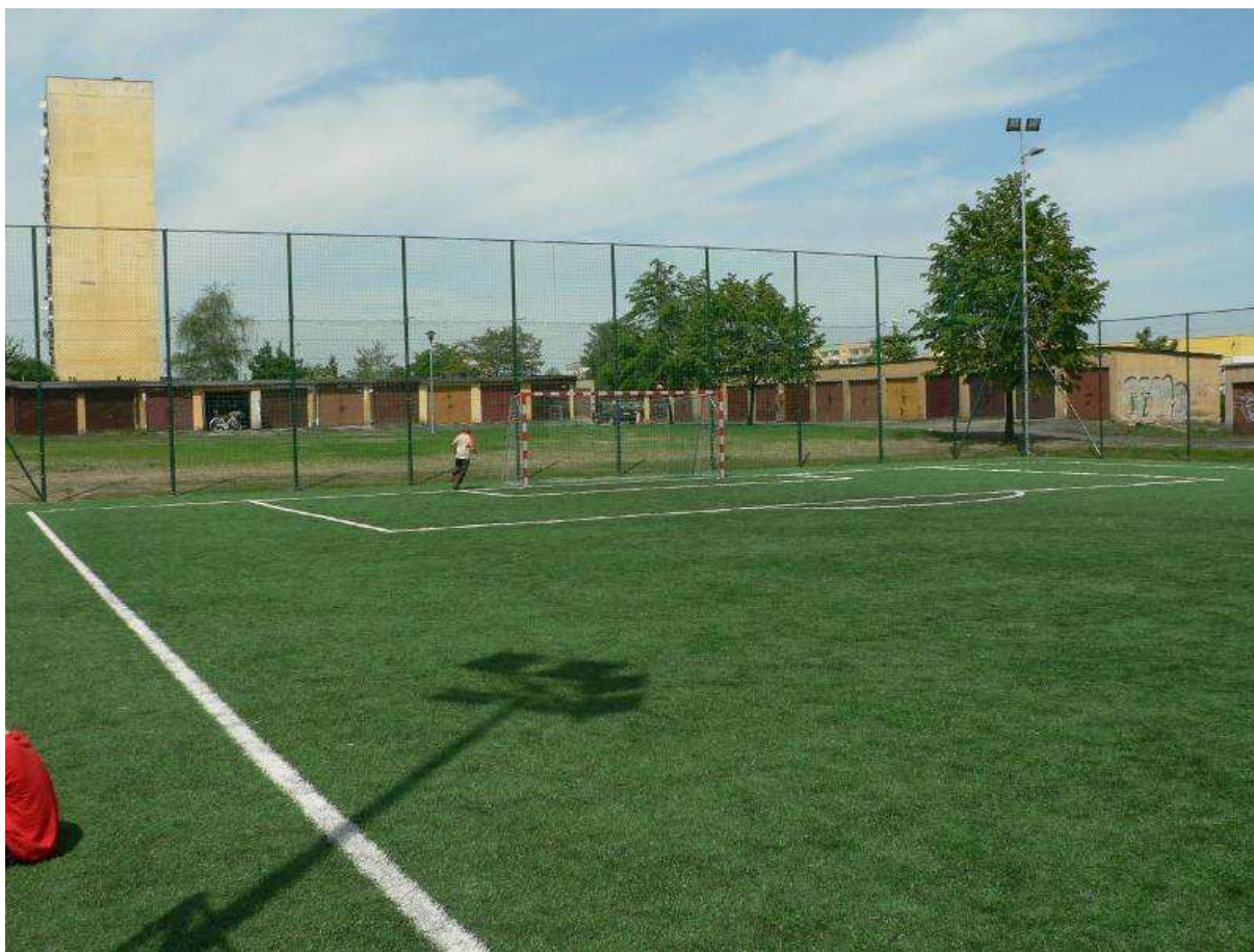
Zdj.4 W tle ogrodzenie boisk wraz oświetleniem zewnętrznym.