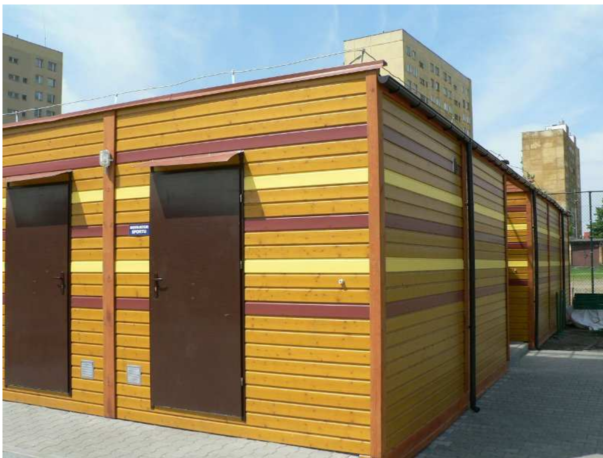
Zdj.5 Pomieszczenia socjalne ( cztery kontenery szatniowo – sanitarne)